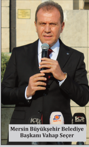
Mersin Büyükşehir Belediye Başkanı Vahap Seçer