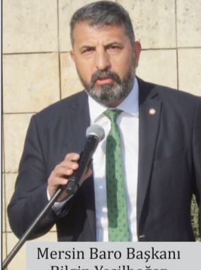
Mersin Baro Başkanı Bilgin Yeşilboğaz