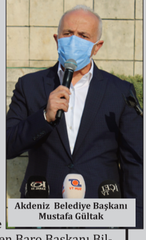
Akdeniz Belediye Başkanı Mustafa Gültak