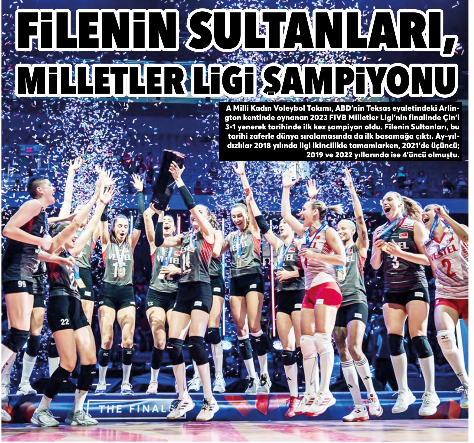
A Milli Kadın Voleybol Takımı, ABD'nin Teksas eyaletindeki Arlington kentinde oynanan 2023 FIVB Milletler Ligi'nin finalinde Çin'i 3-1 yenerek tarihinde ilk kez şampiyon oldu. Filenin Sultanları, bu tarihi zaferle dünya sıralamasında da ilk basamağa çıktı. Ay-yıldızlılar 2018 yılında ligi ikincilikle tamamlarken, 2021'de üçüncü; 2019 ve 2022 yıllarında ise 4'üncü olmuştu.