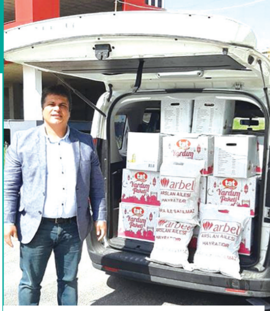
Mersin'in hayırsever iş insanlarının sahip olduğu Arbel, Başkan ve Tat Bakliyat firmalarının ürünlerinden oluşan yardım paketleri ihtiyaç sahibi gazetecilere ulaştırıldı.